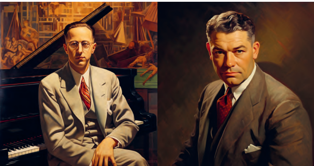
Jerome Kern en Oscar Hammerstein II

verhaallijn werden samengehouden. Bovendien waren de songs van Show Boat op innovatieve wijze ingebed in de plot én liepen songs en gesproken dialogen vaak organisch in elkaar over, wat het publiek verraste.