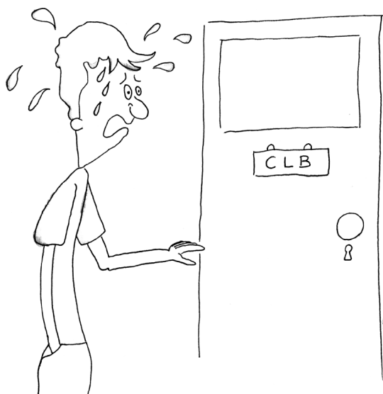
FIGUUR 1. Leerkrachten zien er dikwijls heel erg tegen op dit soort meldingen te moeten doen.

Als medewerkers van het C.L.B. vervulden wij vaak een go-between functie tussen de leerkrachten en de ouders. Vanuit deze positie kreeg ik een goed zicht op de typische gevoeligheden die spelen bij beide partijen en ook op wat er zoal mis kan lopen in de gesprekken tussen de school en de ouders. Verschillende scholen investeren in het opbouwen van een goede relatie met de ouders en bieden hun leerkrachten en pedagogisch personeel (zelfs medewerkers van het onthaal en secretariaat) vormingen aan die hen tools/vaardigheden aanleren voor het omgaan met (moeilijke) ouders of het voeren van 'moeilijke' gesprekken. Leerkrachten hebben vaak nood aan advies voor het voeren van de typische 'slecht nieuws'-gesprekken, zoals het moeten medelen dat een kind niet kan overgaan, een C-attest krijgt, betrapt is op druggebruik op school, zware gedragsproblemen vertoont, spijbelt, dat er een vermoeden van anorexia bestaat, enzovoort. Meestal zien ze er heel erg tegenop dit soort meldingen te moeten doen.