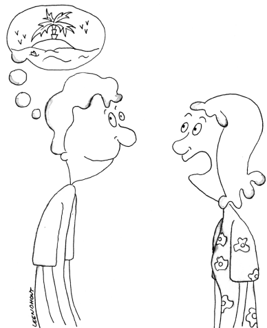
FIGUUR 3. ...aandacht kunnen geven en open en onbevooroordeeld kunnen luisteren...

Deze essentiële basisattitudes om een goede gesprekspartner te kunnen zijn, in functie van het slagen van het gesprek, komen verder in het boek aan bod.