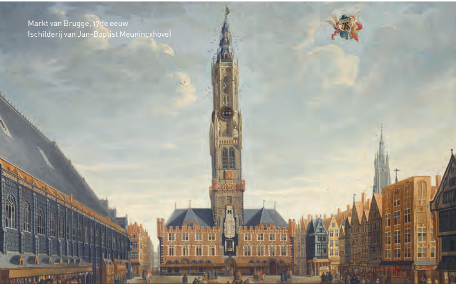
Markt van Brugge, 17de eeuw (schilderij van Jan-Baptist Meunincxhove)

Water heeft bij het ontstaan van Brugge een cruciale rol gespeeld. Op Brugges geboorteplaats vloeiden een aantal beken samen om een rivier (de Reie) te vormen, die dan noordwaarts in de kustvlakte uitwaterde. Via zogenaamde 'getijdengeulen' stond de Reie in verbinding met de zee. Niet te verwonderen dus dat in de Romeinse tijd hier al havenactiviteit te bespeuren viel. Zoveel kan worden afgeleid uit de resten van minstens twee zeewaardige boten die in de buurt van het huidige Brugge zijn ontdekt. We schrijven: tweede helft 3de, begin 4de eeuw. Toch zou het nog ca. 500 jaar duren vooraleer de naam 'Brugge' opduikt. Wellicht een afleiding van het Oudgermaanse woord 'brugj' of aanlegsteiger.